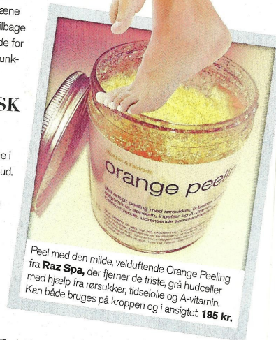
Peel med den milde, velduftende Orange Peeling fra Raz Spa , der fjerner de triste, grå hudceller med hjælp fra rørsukker, tidselolie og A-vitamin. Kan både bruges på kroppen og i ansigtet. 195 kr.