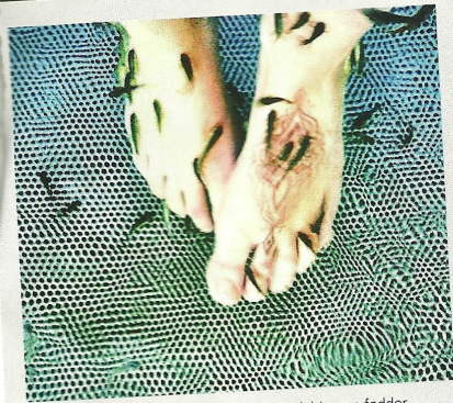
De små glubske fisk guffer i skønhedsredaktørens fødder. Mums!

Den lille sorte ser allerede 50 procent bedre ud på dig, hvis der stikker et par bløde ben ud under skørtet, og fødderne i stiletterne er velplejede og fri for hård hud. Det kan fiskene i klinikken AquaFeet klare for dig. Du stikker simpelthen hele herligheden ned i et bassin, der er fyldt med 100 fisk af arten Garra Rufa, der flokkes om din hud og suger alle de døde celler af. Det føles sært i begyndelsen, men fiskene er dine nye bedste venner og gør dig virkelig blød. 199 kr. for 30 minutter. Se Aquafeet.dk